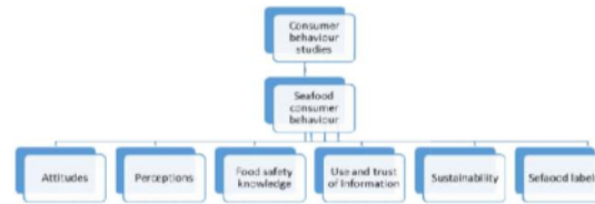
Gambar 2 Studi Perilaku Konsumen terhadap Makanan Laut

pangan, terlepas dari ukuran atau kompleksitasnya.