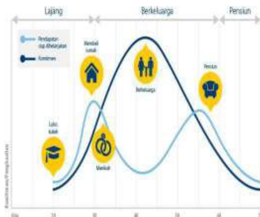
Gambar 2. Tahapan Kehidupan

Kehidupan seorang individu ditandai oleh beberapa peristiwa penting dalam hidupnya, seperti lulus kuliah pada usia rata-rata 22 hingga 25 tahun, menikah pada rentang usia 25-35 tahun, memiliki anak pertama pada rentang usia yang sama, hingga kemudian memasuki masa pensiun pada usia 55 tahun. (mandiri-investasi.co.id) Setiap tahap kehidupan ini memiliki kebutuhan finansial serta tantangan yang berbeda-beda.