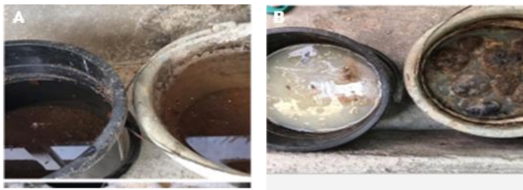
Gambar 3. Pembuatan BA LBP : (A) Sampel hari ke-1, Kiri: S1; Kanan: S2 (B) Sampel hari ke-14, Kiri: S1; Kanan: S2

Tabel 3 menunjukkan hasil pembuatan BA LBP selama 14 hari. S1 terlihat larutan air tanah berubah menjadi berwarna coklat muda dan pada sisi permukaan larutan berwarna putih seperti lapisan nata tipis, sedangkan S2 berubah menjadi berwarna coklat tua dengan bagian permukaan sedikit