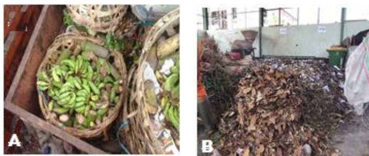
Gambar 1. (A) Limbah Buah Pisang (B) Sampah Organik