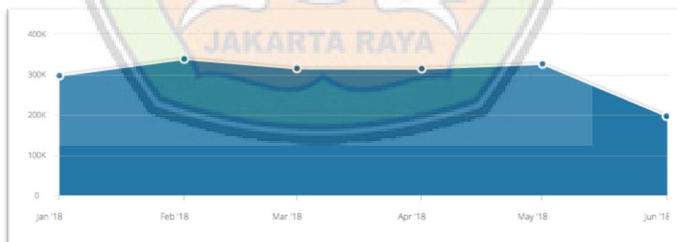
Gambar 1.2 Data Pengunjung Website bekasikota.go.id sumber : www.smilarweb.com

Namun disamping itu ada pula kendalanya yang dihadapi, misalnya dalam pelaksanaannya masih terdapat halaman yang terkadang eror atau tidak terbuka sehingga kurang maksimalnya dalam pemberian informasi yang dibutuhkan, penaruhan artikel di beberapa tampilan masih kurang tersusun rapi, keluhan dari masyarakat yang dikirimkan melalui e-mail kurang direspon atau ditanggapi, dokumentasi kegiatan pemerintah yang dilakukan di Kota Bekasi masih terbilang kurang up to date dapat dilihat dari data media baik berupa foto ataupun video, kendala lainnya adalah kurangnya pengenalan website ini ke masyarakat luas dapat dilihat jumlah pengunjung 6 bulan terakhir pada gambar 1.2 yang berkisar rata - rata hanya 10% dari jumlah penduduk kota bekasi yang mencapai sekitar tiga juta jiwa.