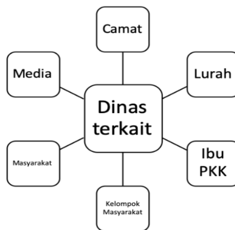
Bagan 4. Sosialisasi Dinas Terkait ke Stakholder dan Masyarakat

tim pelaksana yang menginformasikan berbagai program kepada dinas terkait termasuk media. Tujuannya adalah agar gagasan dan informasi mengenai program dipahami dan diimplementasikan sesuai dengan program yang ditetapkan. Adapun institusi, adalah pemerintah sebagai pihak pengagas dan pelaksana program.