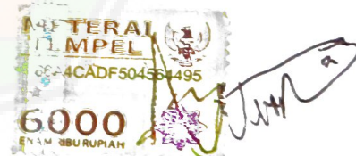
Nergal Sarezzer S