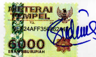
Budiman Sihombing Silaban

Jakarta 18 Juli 2020 Yang membuat pernyataan