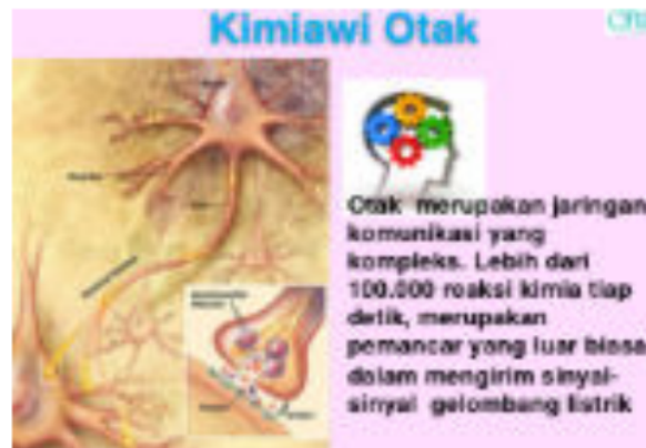
Gambar 2.2 Kondisi Otak dalam Stimulus Hypnosis

tenang dan nyaman. Suatu kondisi yang sangat dibutuhkan oleh para korban bencana alam pada saat itu, karena hilangnya tempat