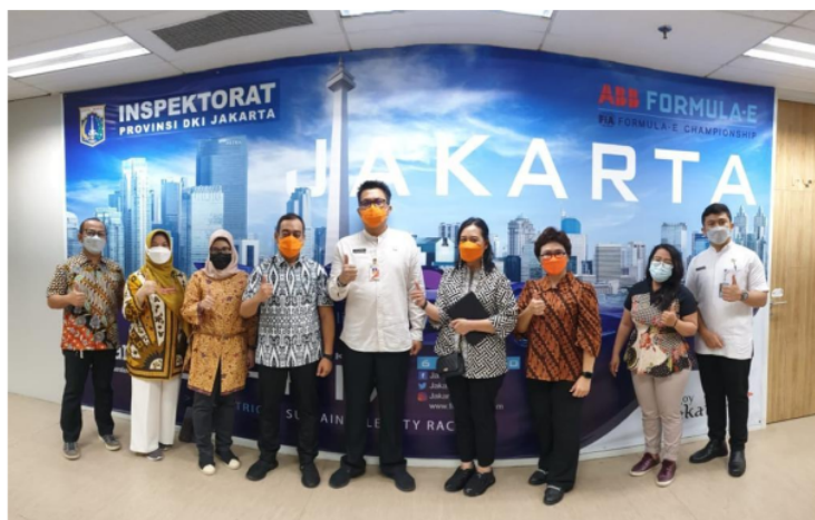
Gambar 5. Prosesi Penutupan Sertifikasi