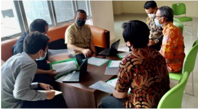
Gambar 3. Proses Validasi dan Verifikasi PKM Sertifikasi BNSP Penyuluh Antikorupsi