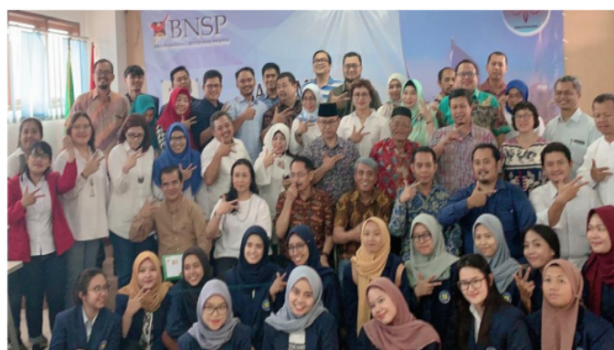
Gambar 6. Pembacaan Pakta Integritas

Kegiatan PKM ini dilaksanakan secara bertahap, yaitu setiap hari melibatkan sekitar kurang lebih empat puluh Asesi dan berlangsung hingga bulan Mei 2021. Tahap pertama seperti pada Bagan Gambar 1. yaitu pengisian APL-01, verifikasi kelengkapan dokumen persyaratan, lalu memasuki tahapan penandatanganan AFR 01 yaitu kesediaan Asesi untuk mengikuti proses Sertifikasi BNSP serta, dilanjutkan dengan Uji Kompetensi yang tertuang pada MAPA-1 berdasarkan MUK (Materi Uji Kompetensi) pada proses sertifikasi. Setelah dinyatakan lolos pra asesmen, maka para Asesi diminta untuk mengikuti Uji Kompetensi yang terdiri dari dua bagian; 1) Uji Kompetensi Presentasi Aspek K3 dan Presentasi Materi Penyuluh, 2) Uji Kompetensi Komprehensif. Para Asesor akan menyediakan pertanyaan dan melakukan observasi yang dinilai oleh para Asesor lain, lalu dirapatkan pada rapat sidang pleno, diikuti dengan pengumuman kompetensi dan terakhir adalah proses distribusi atau pembagian sertifikat. Semua prosesi sertifikat BNSP diakhiri dengan penyusunan laporan guna pengusulan Asesi yang Kompeten untuk diusulkan blanko Sertifikat atas nama Asesi yang dianggap Kompeten.