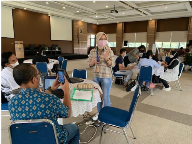
Gambar 4. Proses Pra Uji Kompetensi PKM sertifikasi BNSP Penyuluh Antikorupsi