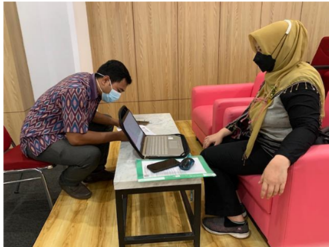
Gambar 1. Proses Pengisian APL-01 PKM sertifikasi BNSP Penyuluh Antikorupsi