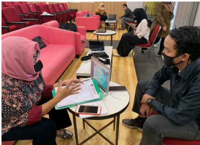
Gambar 2. Proses Pra Asesmen PKM sertifikasi BNSP Penyuluh Antikorupsi