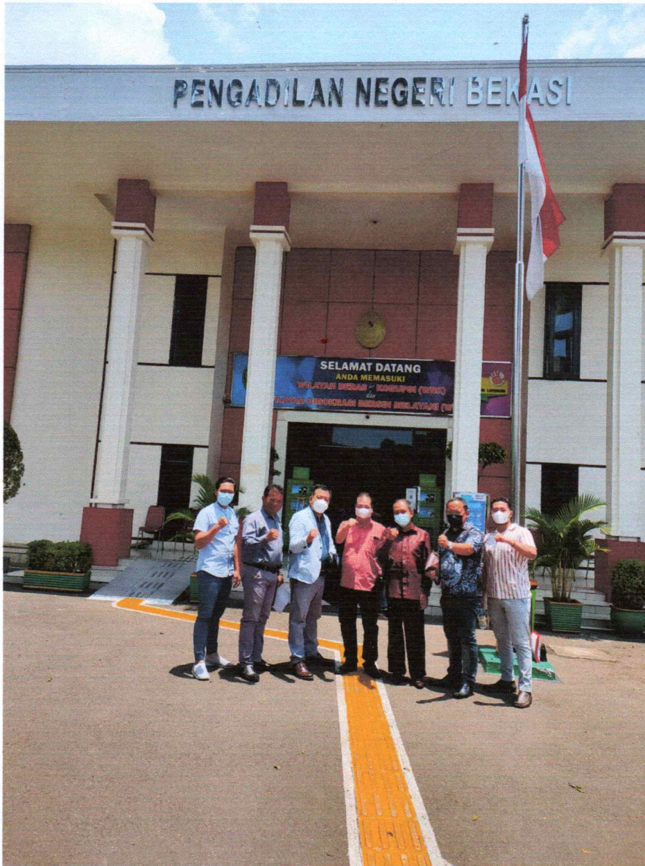
Tim Kuasa Hukum PT. Cipta Kreasi Davindo (CKD) dari Kantor Hukum Tito Hananta Kusuma & Co setelah memenangkan perkara di PN Bekasi, Selasa (26/7/22)

Penolakan Gugatan PT. Delta Djakarta Tbk. dengan No. Perkara 31/Pdt.G/2021/PN.Bks dibacakan Majelis Hakim PN Bekasi dalam sidang yang digelar pada Selasa (26/7/2022). Putusan tersebut dapat diakses melalui e-court pada Sistem Informasi Penelusuran Perkara PN Bekasi.