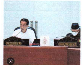
Arahan Presiden Jokowi Dalam Ratas Persiapan Natal & Tahun Baru (61)