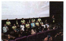
CEK TOKO SEBELAH 2 Di 221222 (82)