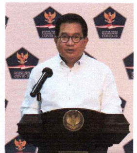
Antisipasi Lonjakan Kasus Covid-19, Pemerintah Berlakukn PPKM Level 1 Jelang Libur Nataru (63)