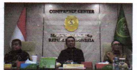
REFLEKSI KINERJA MA-RI 2022, KETUA MA M. SYARIFUDDIN: BAGAIKAN BUAH SIMALAKAMA! (63)