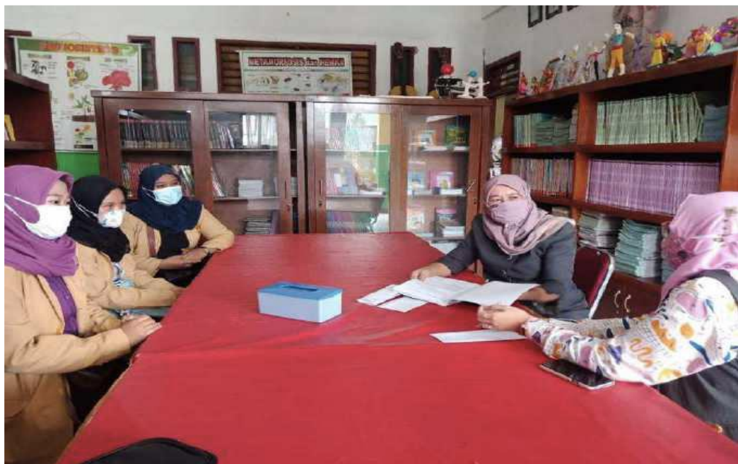
Gambar 3. Kegiatan PKM