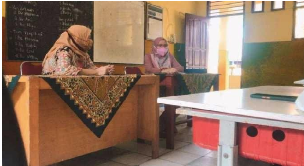
Gambar 2. Kegiatan PKM di mana ketua pelaksana menyampaikan materi

guru dan orang tua terkait permasalahan pembelajaran daring. Berikut gambar pelaksanaan kegiatan: