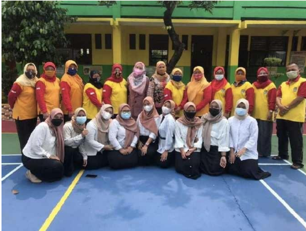
Gambar 4. Foto Bersama Guru dan Orang Tua