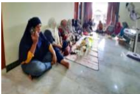
Gambar 2. Pemaparan Materi

Tujuan dari kegiatan abdimas yakni membantu para ibu rumah tangga untuk bisa berkreaitivitas dengan memanfaatkan sampah khususnya sampah - sampah plastik dimana pembuangan sampah itu tidak hanya dibakar atau dibuang begitu saja ke tempat pembuangan sampah pada akhirnya ketempat pembuangan akhir. Akan tetapi sampah itu sebenarnya sampah dapat dipilah-pilah dan dapat dijadikan sebagai kerajinan tangan serta barang yang bernilai ekonomi. Dalam kegiatan sosialisasi, tim memberikan materi kepada peserta mengenai daur ulang sampah. Materi yang disampaikan oleh narasumber dibawakan secara sederhana dan dengan bahasa yang mudah dipahami oleh peserta. Pembahasan materi ini mengenai sistem daur ulang sampah dengan menggunakan konsep 3R yakni Reuse (Menggunakan kembali sampah sampah yang masih bisa digunakan atau bisa berfungsi lainnya), Reduce (Mengurangi segala sesuatu yang mengakibatkan atau memunculkan sampah), Recycle (Mengolah kembali sampah atau daur ulang menjadi suatu produk atau barang yang dapat bermanfaat) (Budi Setianingrum, 2018; Radityaningrum et al., 2017) (Budi Setianingrum, 2018), kemudian menjelaskan pentingnya menjaga kebersihan khususnya kebersihan di sekitar rumah. Kesadaran untuk menjaga kebersihan itu penting dikarenakan saat ini masa pasca pandemi covid 19 yang masih perlu di waspadai mengenai virus - virus yang mengancam kesehatan (Muhammad et al., 2020; Siregar et al., 2021)