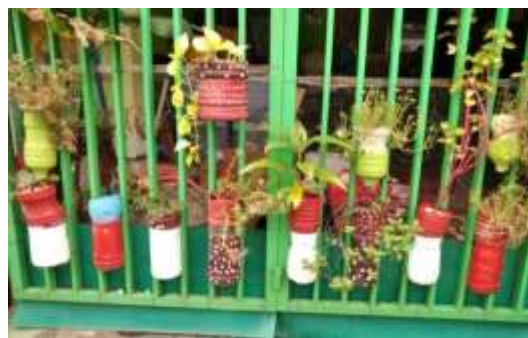
Gambar 4. Hasil dari Kegiatan Abdimas

Program kegiatan ini yaitu pendampingan secara langsung mengenai proses pemanfaatan barang bekas menjadi barang yang berguna, contohnya botol bekas minuman yang dapat dijadikan sebagai pot untuk tanaman dan juga dapat dibuat sebagai alat pembelajaran bagi anak-anak. Salah satu contoh pengelolaan sampah menjadi barang yang berguna yaitu salah satunya membuat sabun atau lilin aroma terapi dari minyak jelantah, cara membuat sabun dari minyak jelantah, yaitu: Pertama, menuangkan air ke dalam wadah dan taburkan soda api, kemudian mengaduknya perlahan, tunggu air hingga suhunya dingin. Kedua, disaat suhu sudah dingin, dimasukan minyak jelantah tersebut sambil diaduk hingga bahan merata dan mengental. Ketiga, agar memiliki aroma dan tampil berwarna maka ditambahkan pewangi dan pewarna makanan ke dalam cetakan sabun. Keempat, setelah mengeras maka sabun dapat langsung digunakan untuk mandi maupun mencuci pakaian.