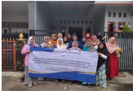
Gambar 3. Kegiatan Pelatihan