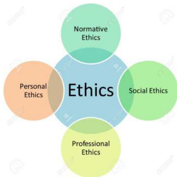
Gambar 7.1. Diagram Pembentukan Etika