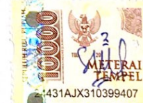
Selvy Dwi Puspitasari