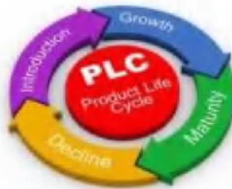
Gambar. Daur Hidup Produk

Contoh product life cycle tahap penurunan misalnya aplikasi jual beli sayur Anda tadi mulai mengalami pengurangan transaksi. Di tahap ini, Anda wajib melakukan inovasi jika tidak ingin kehilangan pengguna.