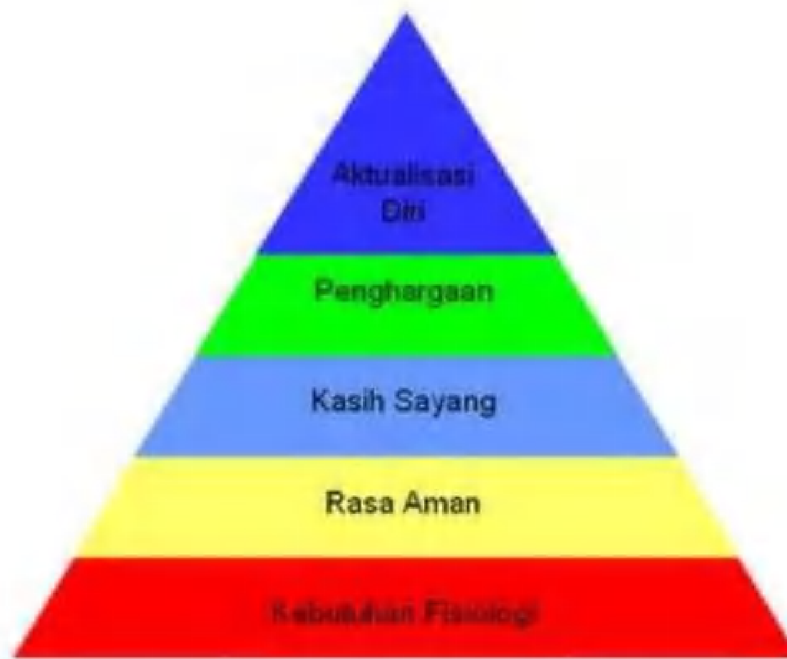
Gambar. Teori Kebutuhan Maslow