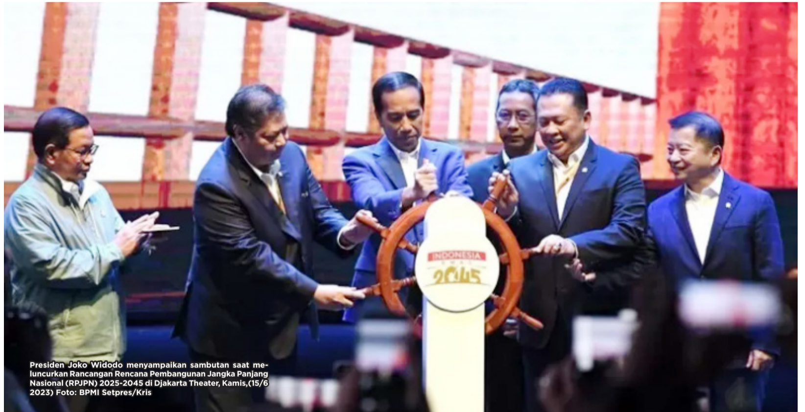
Presiden Joko Widodo menyampaikan sambutan saat meluncurkan Rancangan Rencana Pembangunan Jangka Panjang Nasional (RPJPN) 2025-2045 di Jakarta Theater, Kamis, (15/6/2023)