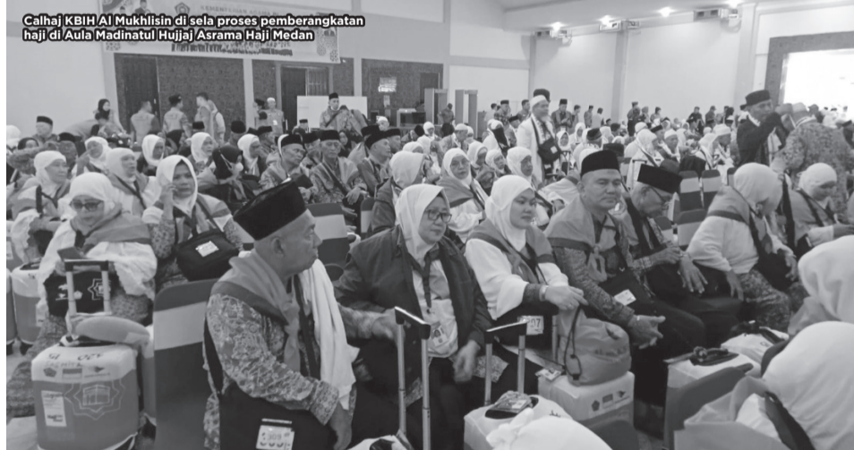
Calhaj KBIH Al Mukhlisin di sela proses pemberangkatan haji di Aula Madinatul Hujjaj Asrama Haji Medan

Seperti diketahui, Kloter 15 memberangkatkan 360 jemaah diantaranya dari 129 jemaah KBIH Hijir Ismail, 80 jemaah Al Fitriyah, 67 jemaah Ikhwanul Ikhlas, 53 Al Mukhlisin dan 23 jemaah Langkat. (bar)