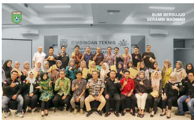
BUMI BERSUJUD SERAMBI MADINAH

Selain itu, Samsir juga berharap desa dapat menggali potensi sehingga meningkatkan Pendapatan Asli Desa (PAD). (Rel/Sabam*)