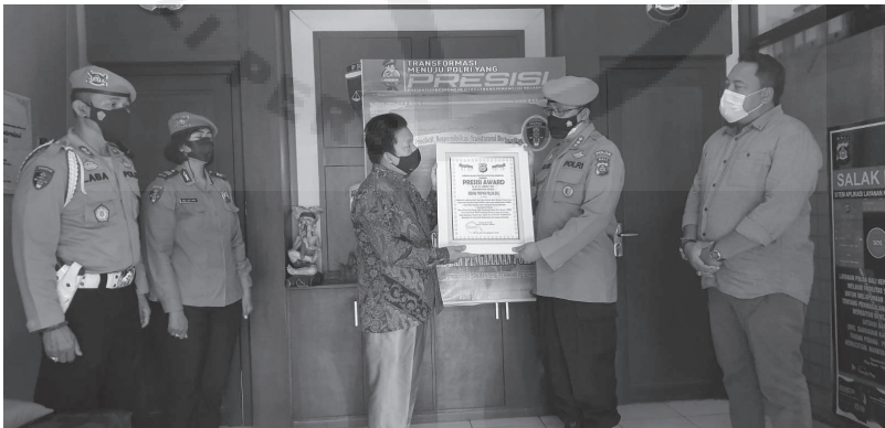
Sumber: Kabinet Propam Polda Bali menerima penghargaan Presisi Award dari Lemkapi untuk inovasi pelayanan keluhan masyarakat secara online .

Di Pulau Dewata, Polda Bali melalui Ditreskrinum melakukan terobosan positif untuk meraih predikat Wilayah Bersih Bebas Melayani (WBBM). Terobosan positif Dit. Reskrinum Polda Bali untuk WBBM, yakni program SIAP BLI (Sistem Aplikasi Pelayanan Berbasis Online ) dan SI PRADA RAJA BALI (Sistem Penyelesaian Perkara Berbasis Restorative Justice dan Adat Bali). Kemudian, kini ada pula aplikasi Simama (Sistem Mediasi Masalah) yang baru diluncurkan dan digagas Propam Polda Bali.