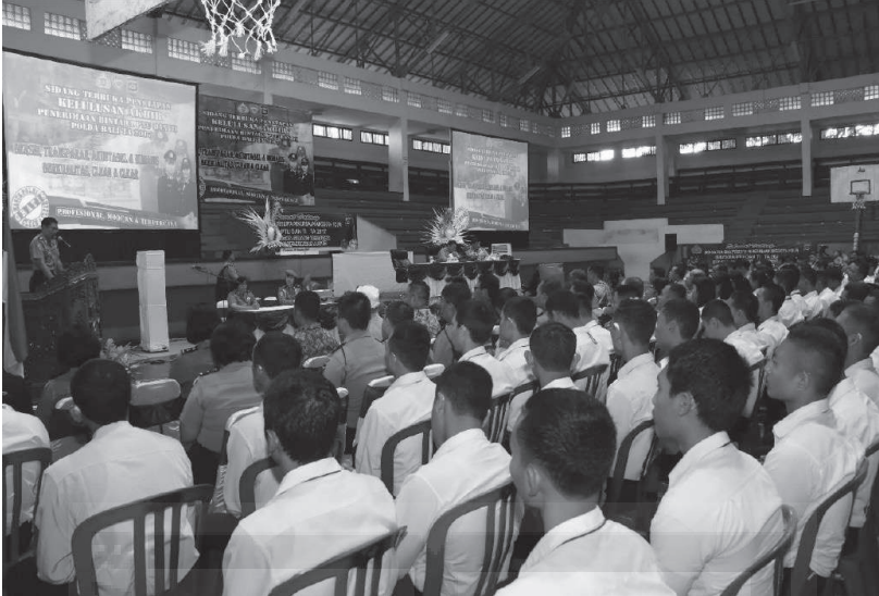
Proses seleksi penerimaan anggota Polri T.A 2017 untuk Bintara Tugas Umum dan Bintara TI Daerah Bali.