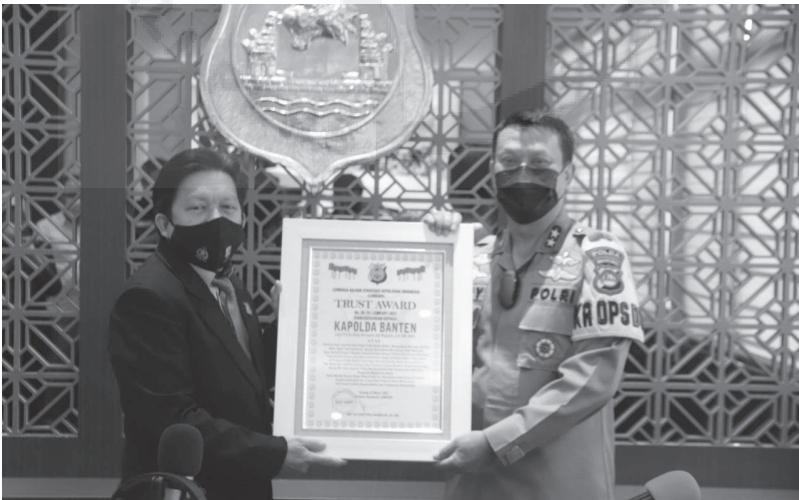
Kapolda Banten Terima Penghargaan Lemkapi