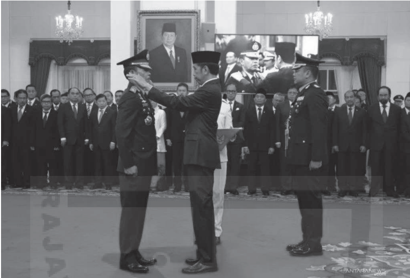
Presiden Jokowi menyematkan tanda kepangkatan kepada Jenderal Pol. Idham Azis setelah dilantik menjadi Kapolri, di Istana Negara Jakarta, Jumat 1 November 2019

akan menjadikan organisasi mampu mencapai totalitas smart policing , yaitu mewujudkan postur Polri yang efektif dalam rangka mendukung pembangunan nasional.