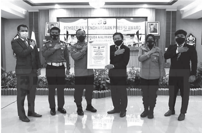
Kapolda Kalteng Irjen. Dedi Prasetyo menerima Presisi Award

Aplikasi Zebres merupakan layanan internal Ditlantas Polda Kalteng untuk mengumpulkan personel ketika ada hal-hal yang penting, seperti kemacetan di jalan raya sehingga memerlukan bantuan personel lintas.