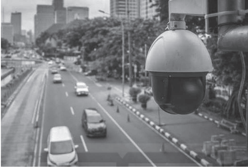
Kendaraan melintas di bawah kamera Closed Circuit Television (CCTV) di Jalan Medan Merdeka Barat, Jakarta, Sabtu 23 Januari 2021.