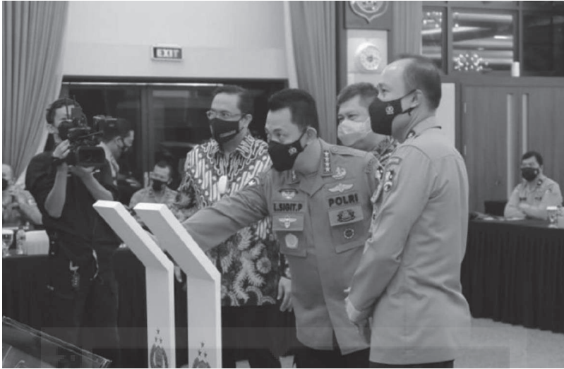
Kapolri Jenderal Pol. Listyo Sigit Prabowo meluncurkan Aplikasi Pengaduan Masyarakat (Dumas) Presisi di Gedung Rupatama Mabes Polri, Jakarta Selatan, Rabu 24 Februari 2021.