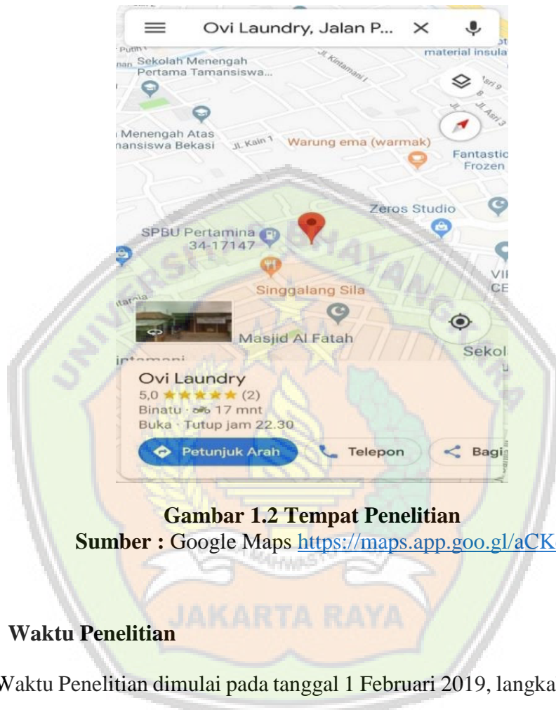
Gambar 1.2 Tempat Penelitian

Bertempat di Ovi Laundry yang terletak di Jalan H. Salam 1 Pengasinan RT 07/01 Rawalumbu, Bekasi Timur, Kota Bekasi, Jawa Barat. 17115.