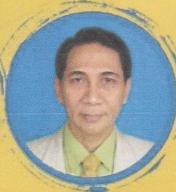
Prof. Pribadiono Quantum HRM Int.