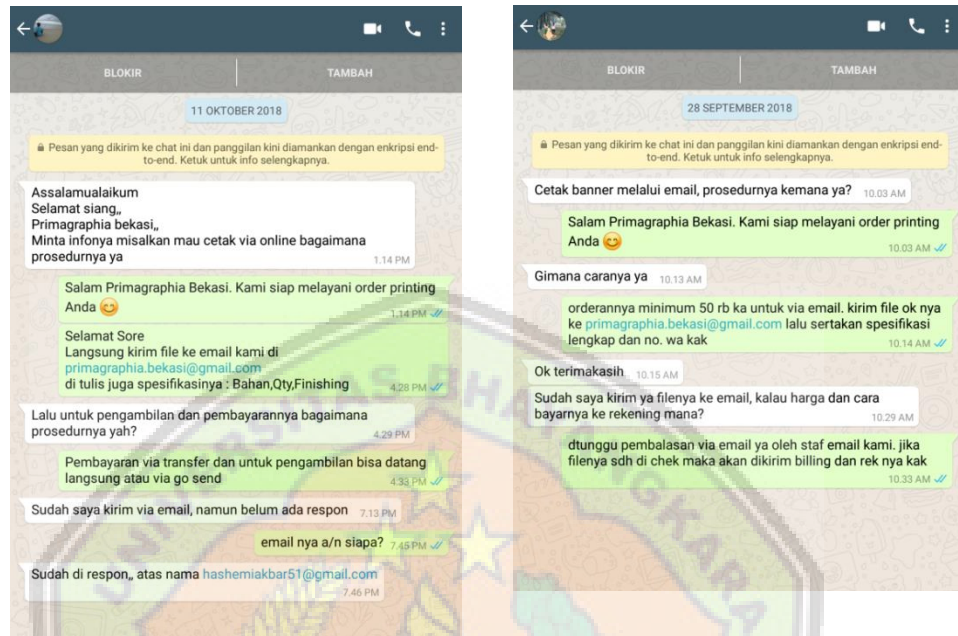
Gambar 1.1. Screenshoot Whatsapp

Whatsapp yang harus melakukan konfirmasi prosedur-prosedur atau proses pengerjaan order printing . Berikut ini adalah 2 dari 10 screenshoot Whatsapp Customer yang belum memahami prosedur order printing yang ada di PT PGB. (lampiran)