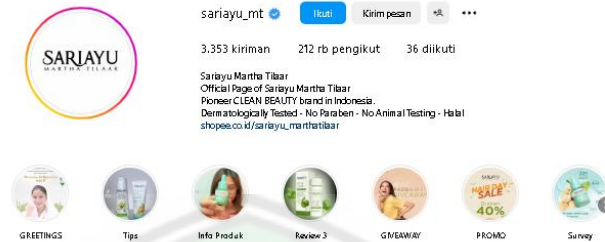
Gambar 1.2 Akun Instagram Sariayu

diminati. Sampai sekarang pada tanggal 16 Oktober 2021 akun Sariayu memiliki jumlah pengikut diinstagram sebanyak 212 ribu. Dengan jumlah postingan sebanyak 3.353.