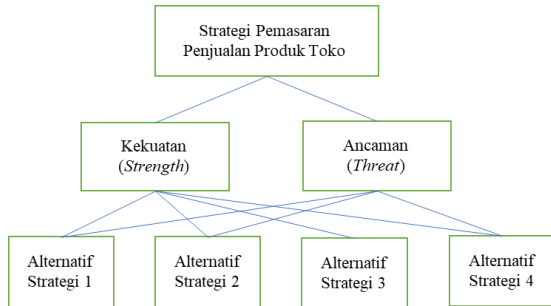
Gambar 4. Hirarki Analytical Hierarchy Process (AHP) Toko Busana Alya

dalam mencapai tujuan pada tingkat pertama, sedangkan tingkatan selanjutnya adalah alternatif-alternatif strategi yang dapat dipilih (Yohana, Karolina, & Tamba, 2021). Pada Gambar 4 akan disajikan hirarki AHP pada penelitian di Toko Busana Alya.