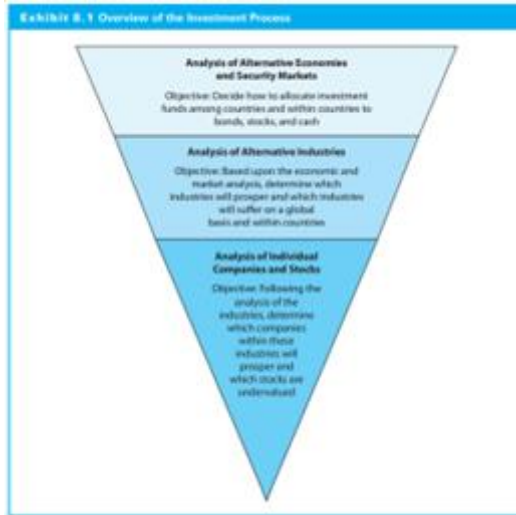
Gambar 1. Pendekatan skema Top-Down

Berdasarkan pendekatan diatas beberapa peneliti/ ahli ikut mendukung pemikiran ini yang dikenal dnegan Three-Step Process .