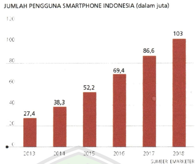
Gambar 1.1 Peningkatan Pengguna Smartphone Di Indonesia

Banyak aplikasi Android yang dapat mendukung atau mempermudah dalam suatu pekerjaan. Aplikasi pembagian waris diharapkan dapat mendukung atau mempermudah dalam pembagian harta waris. Pembagian warisan sering kali menjadi suatu permasalahan yang terkadang memicu pertikaian dan menimbulkan keretakan hubungan keluarga. Penyebab utamanya adalah keserakahan atau ketamakan manusia, dan juga karena kurangnya pengetahuan pihak-pihak yang terkait tentang hukum pembagian warisan. Di samping itu terbatasnya pakar atau orang-orang yang memiliki pengetahuan dan keahlian khusus yang dapat memberikan solusi terhadap orang-orang yang membutuhkan informasi tentang pembagian harta warisan secara islam.