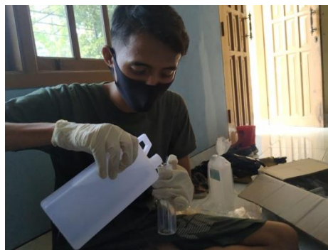
Gambar 2. Pembuatan APD