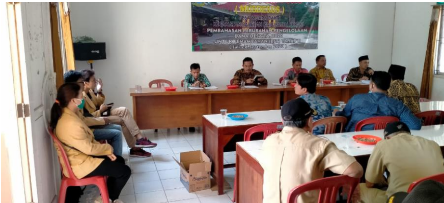
Gambar 9. Rapat Desa (Minggon)