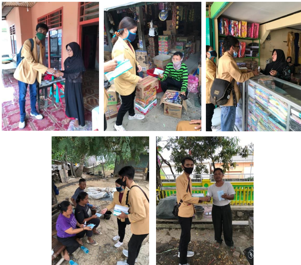
Gambar 6. Pembagian APD ke warga sekitar