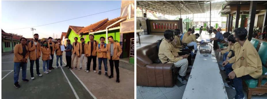
Gambar 1. Penyerahan surat pengantar ke desa