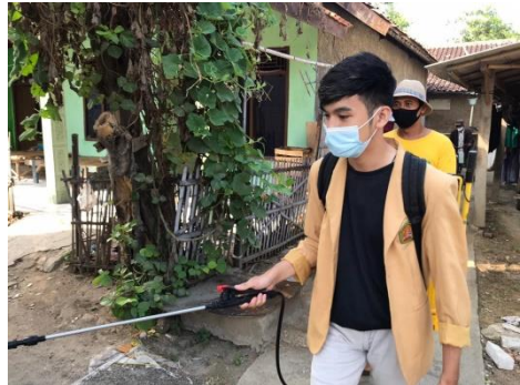
Gambar 8. Penyemprotan desinfektan dibantu TIM GUGUS TUGAS Covid-19