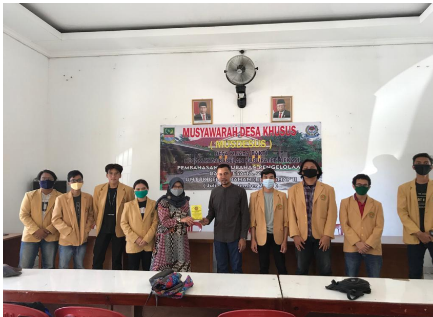
Gambar 10. Perpisahan sekaligus penyerahan kenang-kenangan untuk desa