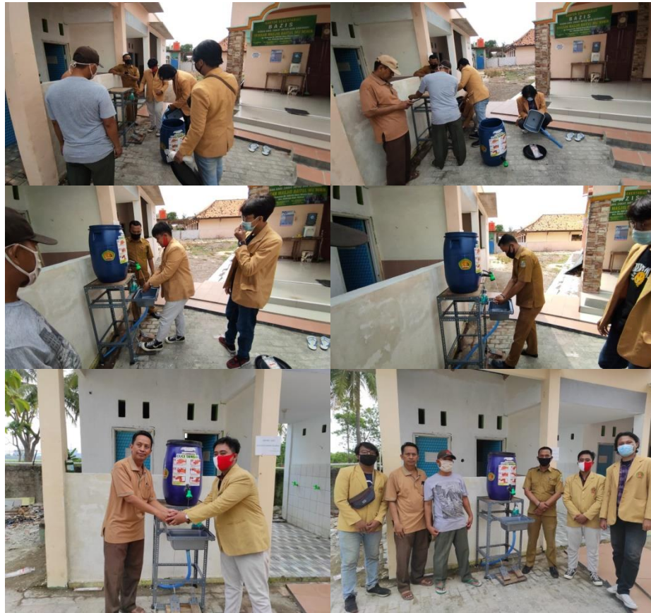
Gambar 7. Penempatan wastavel Covid-19 di Masjid