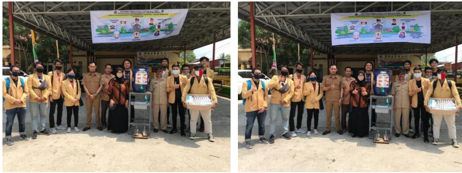
Gambar 5. Penyerahan wastavel dan APD ke desa