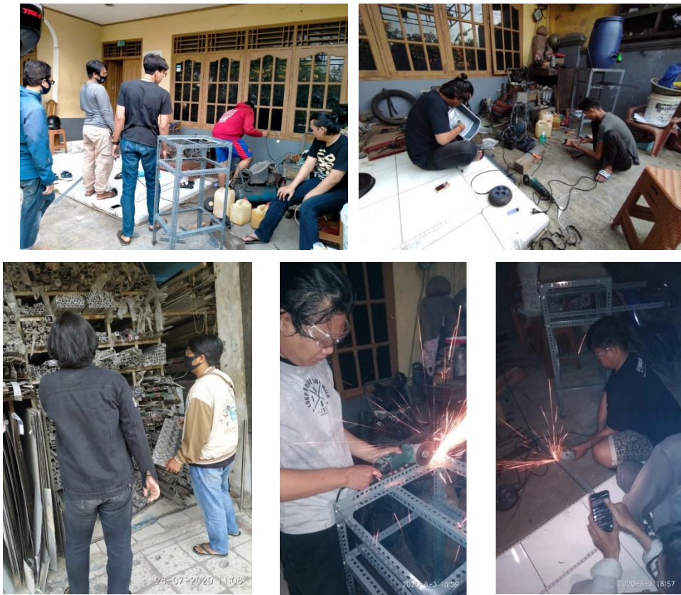
Gambar 3. Pembelian dan perakitan Wastavel Covid-19