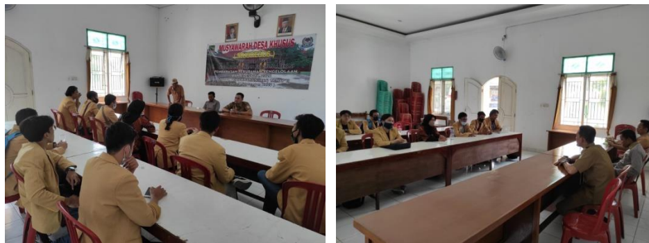
Gambar 4. Breifing membahas program kerja dengan sekretaris desa