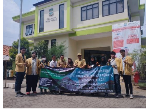
Gambar 4 Pembukaan KKN bersama Lurah dan Sekertaris Kelurahan