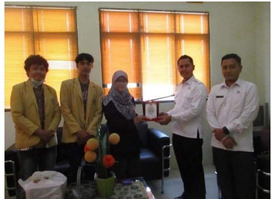
Gambar 9 Penutupan KKN