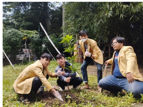
Gambar 6 K3 Penanaman pohon sebagai resapan air baru