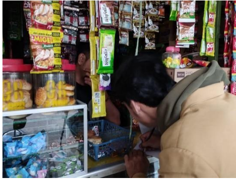
Gambar 7 Wawancara dengan pelaku UMKM