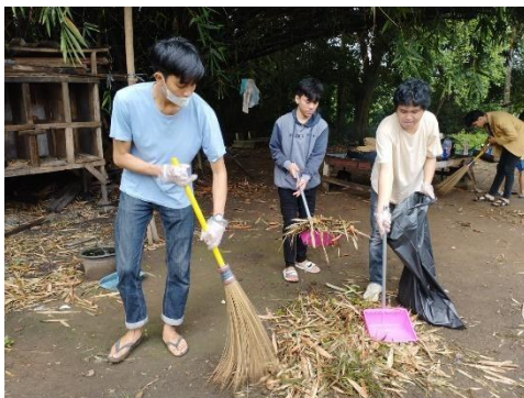
Gambar 5 Pelaksanaan Kerja Bakti K3