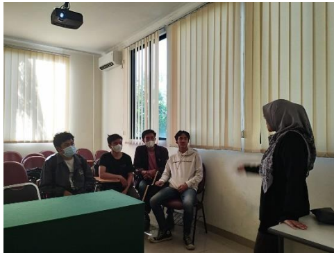
Gambar 1 Diskusi Tema Program Kerja