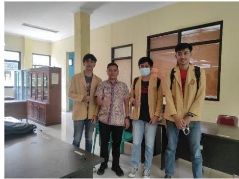
Gambar 2 Diskusi bersama Sekretaris Kelurahan tentang program yang cocok dengan wilayah setempat