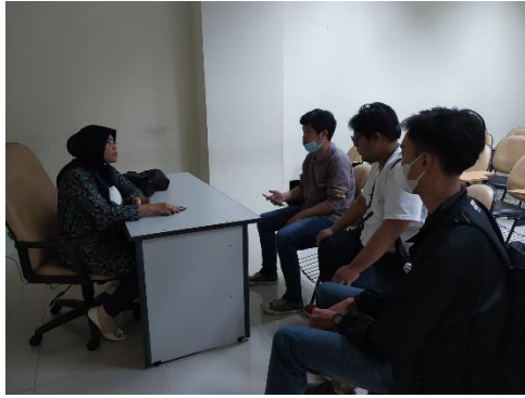
Gambar 3 Diskusi Program Kerja