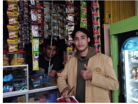
Gambar 8 Foto Bersama Pelaku UMKM