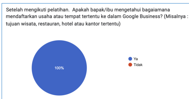
Gambar 9. Grafik Responden Tentang Pengetahuan Mendaftarkan Usaha Ke dalam GMB Setelah Pelatihan