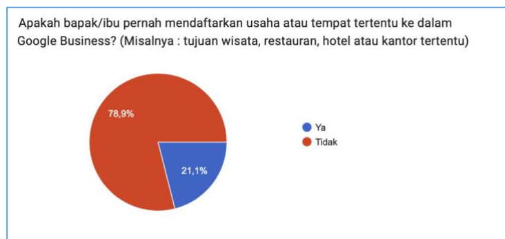
Gambar 7. Grafik Jawaban Responden Tentang Kemungkinan Menggunakan GMB Untuk Pengelolaan Usaha Hasil Post-Test Terhadap Peserta Pelatihan