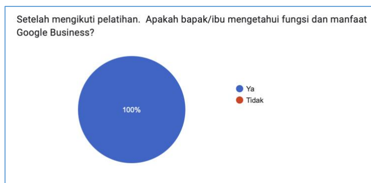
Gambar 8. Grafik Responden Tentang Fungsi dan Manfaat GMB Setelah Pelatihan

Munandar dkk.,Pemanfaatan Google My Business Untuk Peningkatan Skill... Jurnal Dharmabakti Nagri, Vol. 1 No. 2, April – Juli 2023 : 80 – 90