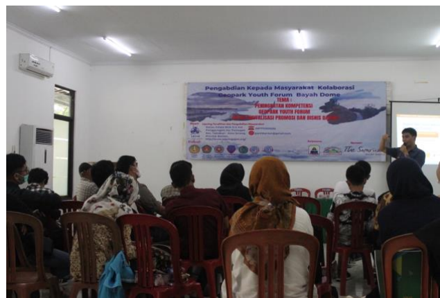
Gambar 3. Peserta (Geopark Youth Forum) Pelatihan Kegiatan PKM