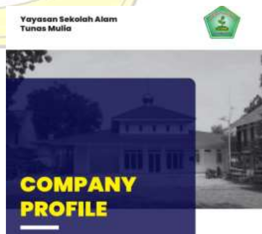
Hasil praktek pembuatan profil siswa dan mahasiswa PkM

Kemudian pemateri menamahkan terkait tips untuk membangun profil digital yang efektif, antara lain: konsistensi (pastikan informasi di berbagai platform konsisten); profesionalisme (gunakan bahasa dan gambar yang mencerminkan citra profesional); aktif (terlibatlah dalam diskusi, bagikan konten berkualitas, dan perbarui profil secara berkala); dan privasi (kelola pengaturan privasi untuk melindungi informasi pribadi yang tidak ingin dibagikan). Pemateri menandakan bahwa dengan memperhatikan elemen-elemen ini, anda dapat membangun profil digital yang kuat dan efektif, yang dapat mendukung tujuan pribadi atau professional anda.