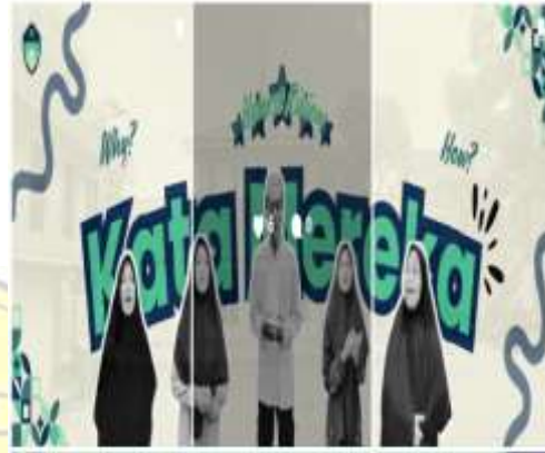
Konten pandawa 1, Guru dan Siswa

dibimbing dan ditemani oleh para mahasiswa. Selesai acara pelatihan ini, selanjutnya dilakukan acara penutupan kegiatan PkM.