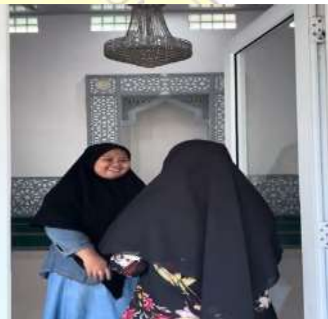
Konten pandawa 2, siswa dan siswa