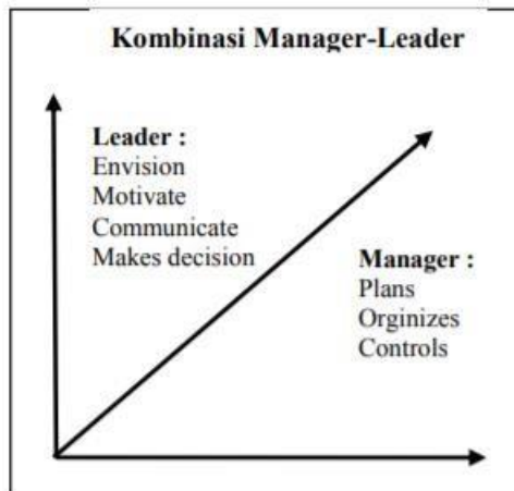
Gambar 1 Kombinasi Leader-Manager

Kombinasi tersebut dapat digambarkan sebagai berikut: