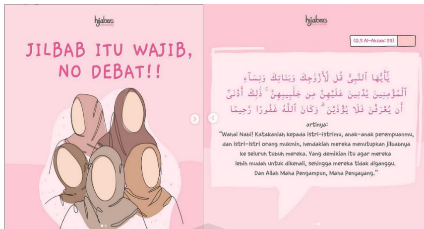
Gambar 1.1. Tampilan Postingan Akun Instagram @hijaberscommunityofficial Dalam Mengajak Followersnya Menggunakan Jilbab