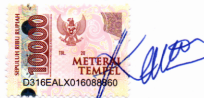
Kezia Priscilla Sihombing