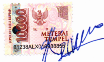
Kezia Priscilla Sihombing