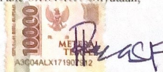
Muhammad Reza Syah Fahlevi