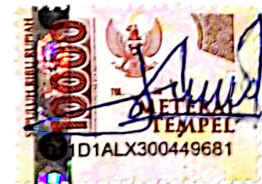
Shyva Azhari N