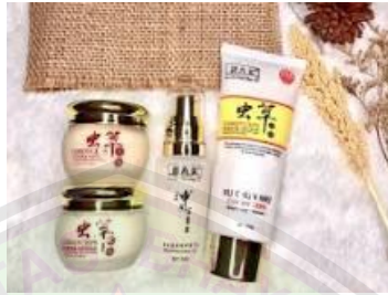
Gambar 1. Produk Yu Chun Mei

Perlu adanya perlindungan hukum bagi pemerintah untuk mengatasi peredaran kosmetik berbahaya, agar konsumen merasa aman dan dilindungi. Bahwa sampai saat ini masih banyaknya kosmetik yang tidak ber BPOM dan tidak belabel bahasa Indonesia di Indonesia, dengan salah satu contoh produk yang bernama Yu Chun Mei yang berasal dari China.