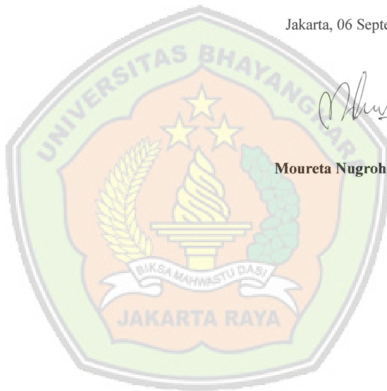
Moureta Nugroho Aritonang