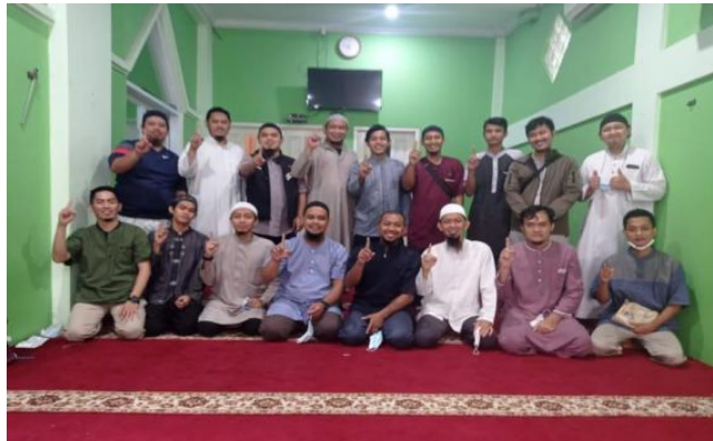
Gambar 5. Pelaksanaan Pelatihan Penerapan manajemen organisasi Hari ke 2 & 3