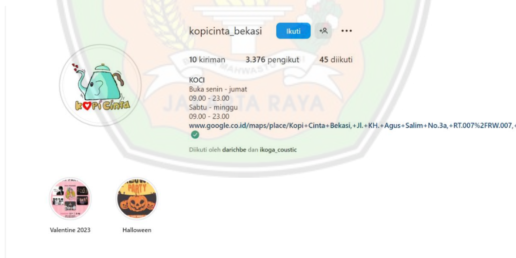
Gambar 1.1 Kopi Cinta Bekasi

Kopi Cinta Bekasi (Koci) adalah sebuah coffee shop yang berada di Bekasi beralamat di daerah Agus Salim Bekasi. Kopi Cinta Bekasi berdiri pada tanggal 13 Juni 2022, coffee shop ini menggunakan tema rumah karena menurut Sejiwa selaku headbar tempat yang disewa oleh coffee shop ini memang rumah yang sudah lama tidak digunakan, lalu disewakan untuk menjadi tempat usaha yang akhirnya dibuat coffee shop .