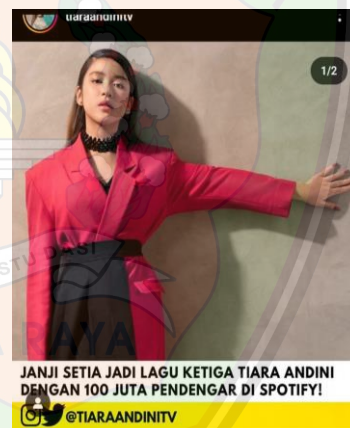
Gambar 1.4 100 Juta Pendengar Spotify