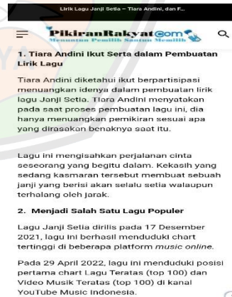
Gambar 1.6