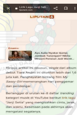
Gambar 1.2 Liputan6.com