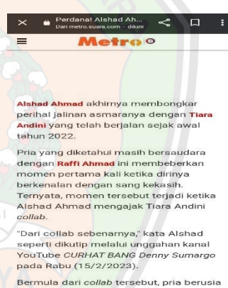
Gambar 1.8 Metrosuara.com