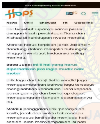
Gambar 1.7 hops.id

Lirik lagu janji setia juga sesuai dengan kisah percintaan tiara andini dengan alshad ahmad di kehidupan nyata mereka. Mereka harus terpisah jarak antara Jakarta-Bandung dalam menjalani hubungan hingga membuat keduanya saling merindu. Tiara Andini dan Alshad Ahmad menjalin asmaranya sejak awal tahun 2022, tetapi keduanya mulai menjalani hubungan berpacaran sejak Maret 2022 yang berawal dari kolab untuk konten Youtube dan hubungan mereka diketahui publik sejak saling membagikan momen manis di media sosial. Seperti yang diunggah pada situs berita online dibawah ini :