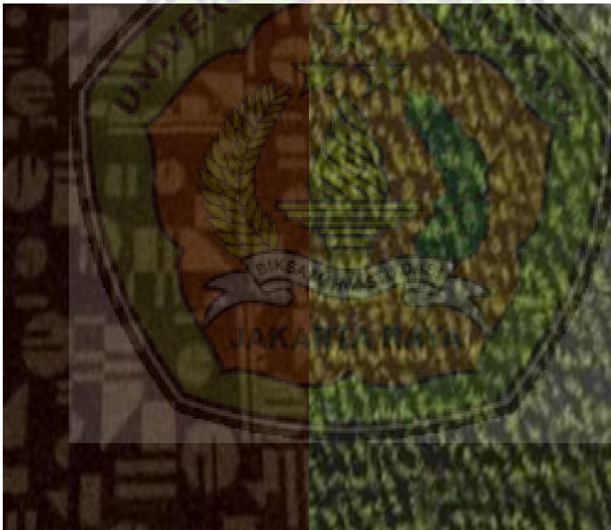
Gambar 1.1 Produk Karpet Custom

PT. Hernadhi Jaya Abadi memproduksi karpet handtufted design custom yang dikerjakan secara manual dengan menggunakan mesin hand gun dengan berbagai ukuran. Pada gambar 1.1 dibawah ini adalah produk karpet custom yang dihasilkan di PT. Hernadhi Jaya Abadi.