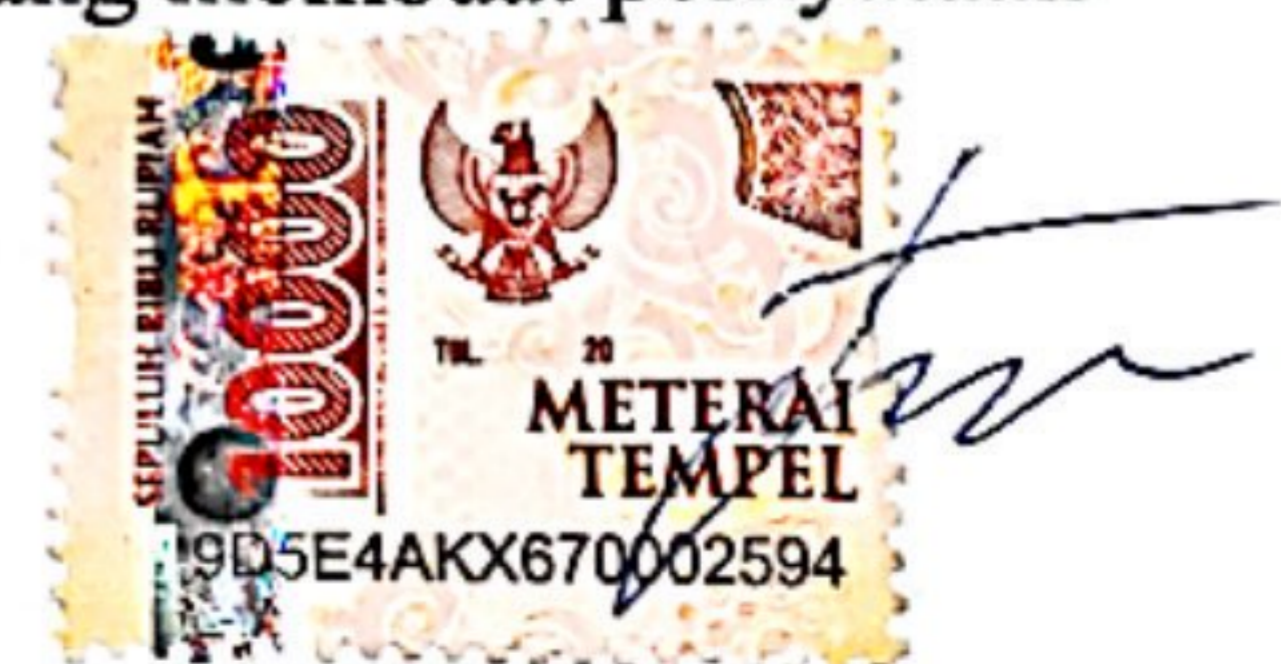
Yoga Manggala Wisnu

Jakarta, 19 November 2023 Yang membuat pernyataan