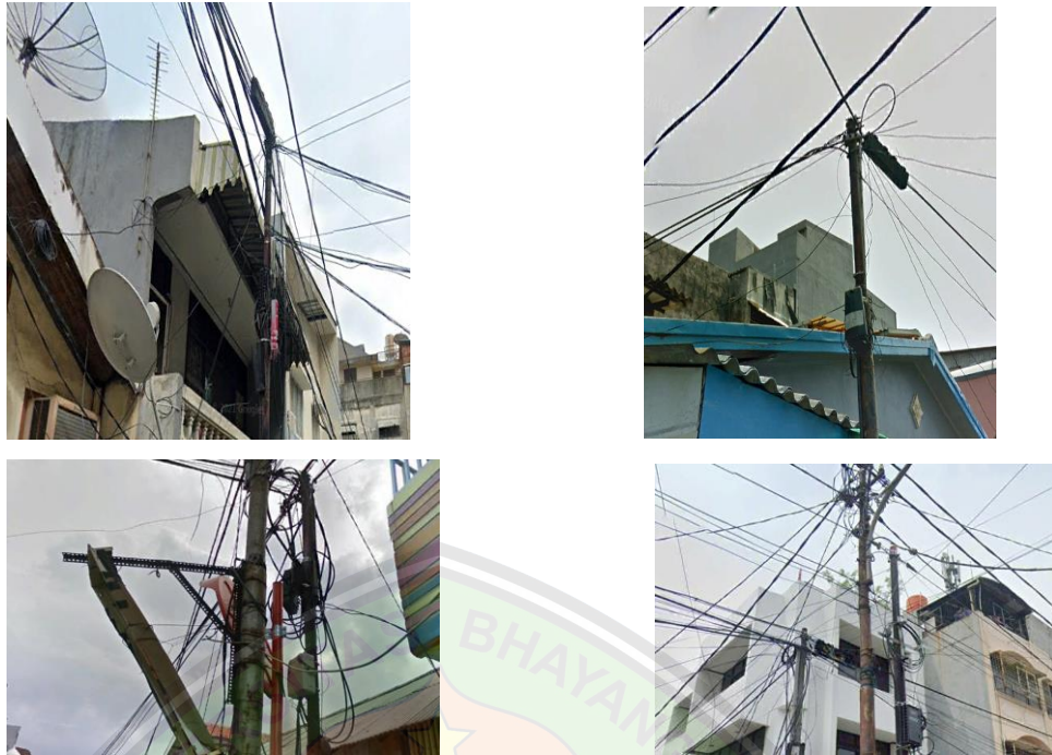
Gambar 1. 2Kondisi Jaringan FTTH JL. Duri

Pada pemasangan proyek di JL. Duri, Kelurahan Gambir. Selama pelaksanaan proyek, tidak dilakukan pertimbangan yang memadai terhadap aspek ini, sehingga biaya yang dikeluarkan untuk penggunaan kabel fiber optic menjadi sangat tinggi. Selama ini, pemasangan kabel fiber optic dalam penentuan jalur distribusi cenderung langsung disambungkan dari kantor pusat (STO) menuju ke rumah pelanggan dengan metode one tube one core , tanpa melibatkan Optical Distribution Cabinet (ODC) dan Optical Distribution Point (ODP).