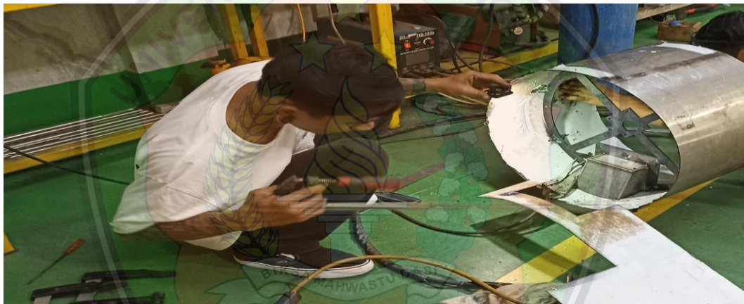
Gambar 1. 1 Gambar Operator Pada Saat Proses Pengelasan Pembuatan Drum Pada Mesin Sangrai Kopi.

Maestro Coffee Roaster sangat konsen dalam berbagai riset, baik dalam menguji kontaminasi negatif yang dihasilkan material yang ditimbulkan mesin sangrai pada umumnya. Maestro Coffee Roaster juga sudah membuktikan kekuatan mesin roasting kopi atau penyangrai kopi dengan pengujian 5 x 24 jam non-stop produksi tanpa keluhan. Dengan spesifikasi mesin yang bermutu, berkualitas dan berstandar SNI & Internasional.