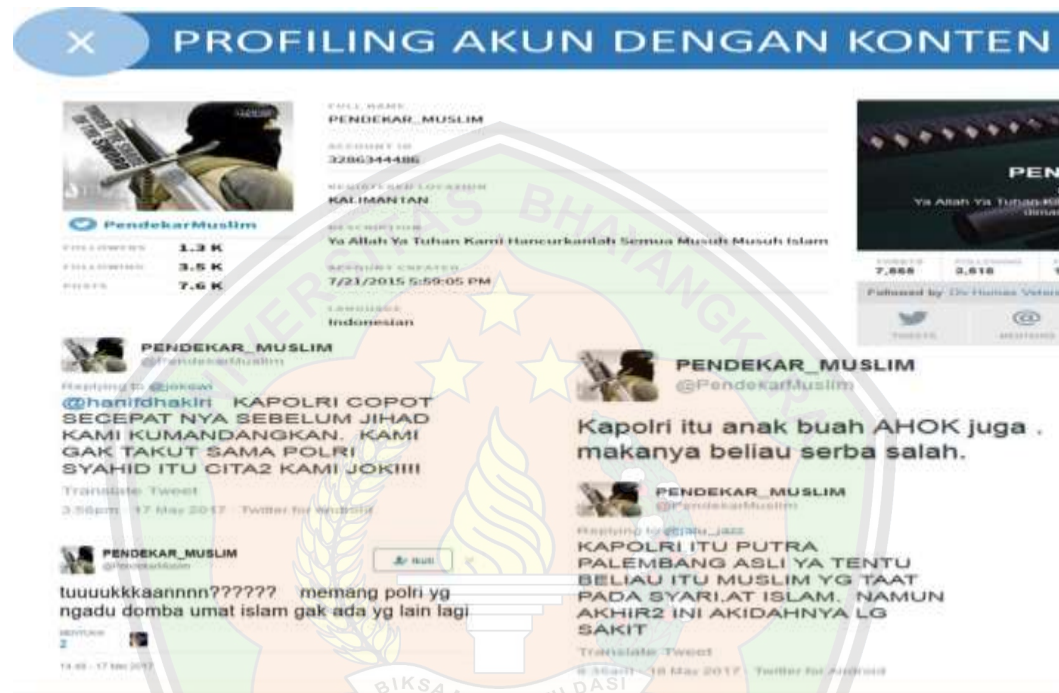
Gambar 1.1. Profiling akun dengan Konten

Dalam hal penyebaran radikalisme oleh para teroris saat ini mereka menggunakan komunikasi massa dikenal teori gelombang kebisuan dan opini publik yang menyatakan bahwa publik akan cenderung mengikuti opini yang sedang berkembang, dan publik minoritas yang memiliki suara lain cenderung akan diam. melihat fenomena maraknya pemberitaan tentang terorisme dengan menggunakan perspektif teori ini. 2 Jika, pemberitaan berbagai media massa banyak yang mbingkai pemberitaan tentang terorisme, maka media lain yang sebenarnya ingin memberitakan isu lain di luar terorisme akan berpikir ulang untuk memberitakan, karena perhatian publik akan lebih banyak tertuju pada pemberitaan tentang terorisme.